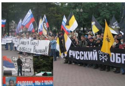
Pravda 12.08.2008. godine

U tome su naročito prednjačili dnevni listovi Kurir i Pravda , a u Večernjim novostima je u periodu od 3.08 do 16.08.2008. godine, izlazio krajnje afirmativan feljton o Radovanu Karadžiću pod nazivom “ Radovan Karadžić od mita do Haga ”.