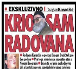
Kurir 26.07.2008. godine

Već ovi „protesti“ su bili veoma nasilni (prebijeno je nekoliko novinara i fotoreportera, od kojih je snimatelj TV B92 zadobio teške telesne povrede), ali se nasilje nije ispoljavalo samo tako, nego i verbalno slanjem neskrivenih poruka mržnje, diskriminacije i netolerancije, pravdanjem zločina i pozivanjem na nasilje. Mediji su ove „proteste“ uglavnom pratili neutralno, u skladu sa dominantnom politikom, kao da se radi o legitimnom negodovanju protivnika Haškog Tribunala, dok je nekoliko pisanih medija otvoreno podržavalo ove nasilničke skupove.