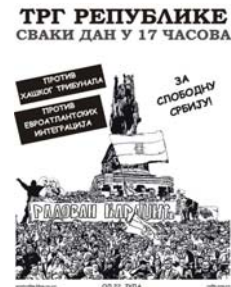
Plakat Pokreta 1389. sa pozivom na svakodnevne proteste

Tim povodom, 30. septembra 2008. godine, YUCOM i Žene u crnom su uputile pismo solidarnosti sa Sonjom Biserko, koga je istog dana podržalo više od 30 nevladinih organizacija, povodom vandalskog napada na Helsinški odbor od strane nasilničke grupe koja sebe naziva Pokret 1389 . Tražeći prijem kod predsednika Srbije Borisa Tadića i ministra unutrašnjih poslova Ivice Dačića , nevladine organizacije su takođe pozvale državne organe da konačno počnu da poštuju Ustav i zakone ove zemlje i da prestanu da tretiraju pravna pitanja kao ideološka i politička i da u skladu sa Ustavom i zakonima ove zemlje, što podrazumeva i ratifikovane međunarodne dokumente, da konačno počnu da primenjuju odredbe koje se odnose na zabranu rada i delovanja onih organizacija koje u svom radu promovišu ideje mržnje, diskriminacije, rasizma i svih drugih oblika netolerancije i mržnje, i to bez politikantskih kalkulacija i špekulacija.