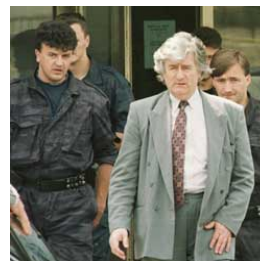
Uzima vodu čita vladiku Nikolaja Večernje novosti 24.07.08

Prateći pojave govora mržnje, YUCOM je odmah ukazao da napetost - koja je postajala sve evidentnija - može da eskalira i u nasilje, odnosno zločin iz mržnje kao posledicu govora mržnje iznošenog i prenošenog putem medija. Najava održavanja „velikog mitinga podrške Radovanu Karadžiću“ u organizaciji Srpske Radikalne stranke bila je, po mišljenju YUCOM-a, razlog za alarm i za intervenciju od strane države. Na najavljenom i odobrenom mitingu Srpske radikalne stranke 29. jula 2008. godine, došlo je i do nasilja i do uništavanja imovine, čemu su nesumnjivo doprineli „zapaljivi govori“ učesnika mitinga. Po oprobano obrascu od 21. februara 2008. godine (protestni skup povodom proglašenja nezavisnosti Kosova) određene grupe razbijale su izloge, uništavale radnje i napadale policiju, nakon čega je i policija interevenistala.