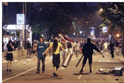
Gadali policiju kamenicama: Grupa huligana sprečila najavlvenu protestnu šetnju

Nekoliko nedelja kasnije, jedan od učesnika demonstracija preminuo je od posledica povreda zadobijenih u obračunu sa policijom, a bilans „protesta“ je da je povređen 51 policajac i 23 demonstranta. YUCOM je početkom avgusta, zajedno sa velikim brojem nevladinih organizacija, kao i političkih stranaka, oštro osudio nasilje, zahtevao od policije da podnese izveštaj o događajima na mitingu, te da li je došlo do prekomerne upotrebe sile i još jednom se javno založio za uvođenje krivičnih dela govora mržnje i zločina iz mržnje 1 .