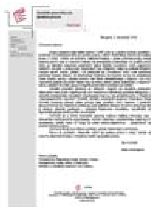
Saopštenje YUCOM-a povodom napada Pokreta 1389.

Zbog ove „posete” YUCOM je od državnih organa zahtevao da konačno preduzmu adekvatne mere protiv „nasilnika koji već mesecima maltretiraju građane Beograda, a naročito predstavnike nevladinih organizacija koje su već proskribovane u medijima “netransparentnih vlasnika i ‘Politici’”.