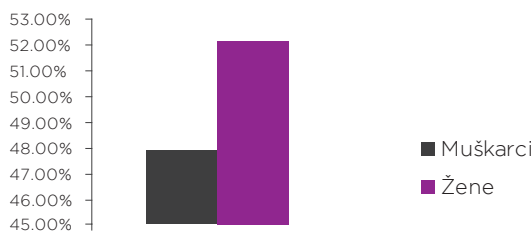
Odnos muškaraca i žena kod stanovništva koje živi ispod linije siromaštva

Faktičko stanje govori da i u drugim oblastima političkog života, a naročito u izvršnoj vlasti, na svim nivoima postoji neophodnost afirmativnog pristupa u cilju postizanja pune ravnopravnosti i punog učešća žena. Podaci pokazuju da je u Vladi, u periodu od 2008. do 2011, bilo svega 5 ministarki u 24 ministarstva. U periodu od 2008. do 2012, od 159 predsednika opština, samo u 7 opština su žene bile predsednice. U diplomatiji, Republika Srbija ima 10 žena ambasadorke i 4 žene generalne konzulke (9,24%).